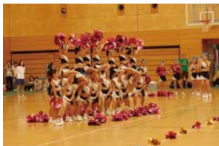
川崎キッズチアリーディングクラブの演技