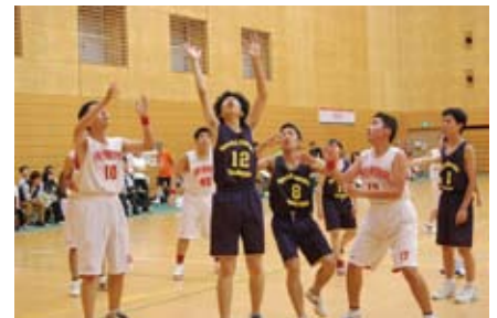
東京トライアングル VS 青森King Oh Red