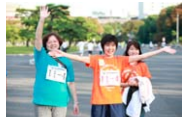
最終走者が待ってます