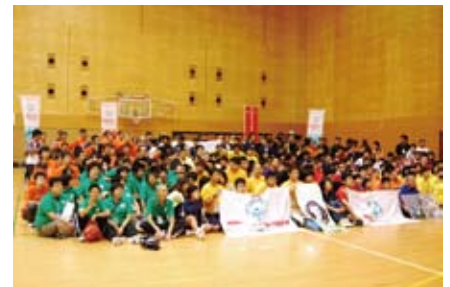
開会式 全員で記念撮影