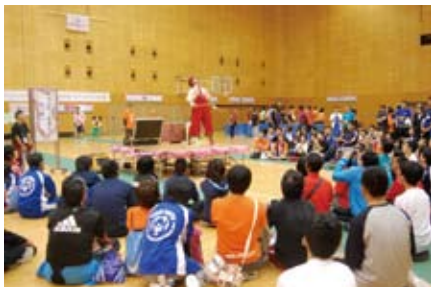
交流会の楽しいパフォーマンス