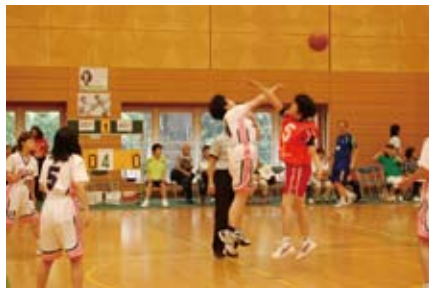
東京きずな VS 新潟レッドフラワーズ