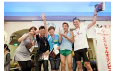
1位の「カルティエ チーム兼子」