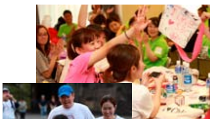
交流会でアートフラッグ完成