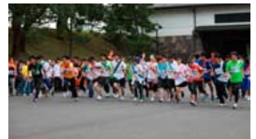
宣言タイムレース スタート