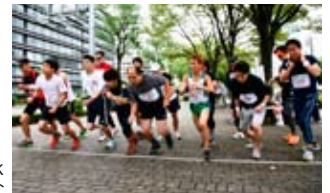
タイムトライアル10K スタート

お天気が心配されましたが、今年も無事にイベントを終えることができました。ご寄付、ご後援、ご協賛・ご協力いただきました団体・企業・個人の皆様、競技に参加された方々に心より御礼申し上げます。