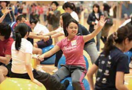
第12回ウォーク&ラン フェスティバル 交流イベント