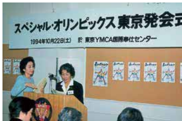
スペシャルオリンピックス日本・東京 発会式