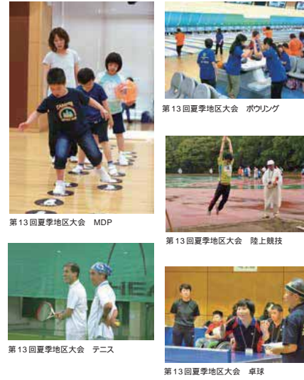
第13回夏季地区大会 MDP