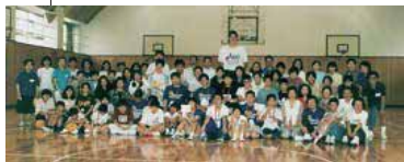
バスケットボール 開始