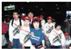
夏季ワールドゲーム・コネチカット