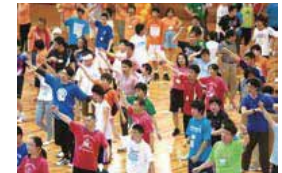
20周年記念地域交流会 in みなと みんなでダンス