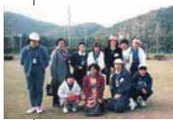
夏季ナショナルゲーム・熊本 記念撮影