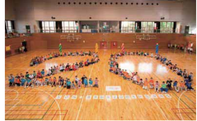
20周年記念地域交流会 in みなと 20周年の人文字