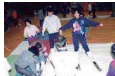
アルペンスキー 開始